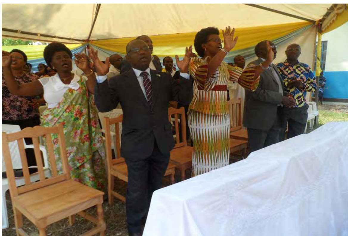
Les autorités politiques et administratives participants aux cérémonies de clôture du Forum national des jeunes (au milieu la Ministre de la Jeunesse et l'ancien Président de la République, à droite et à gauche le Gouverneur de la Province Cibitoke et l'Ambassadeur Président de l'Institution traditionnelle des BASHINGANTAHE « les sages notables »)