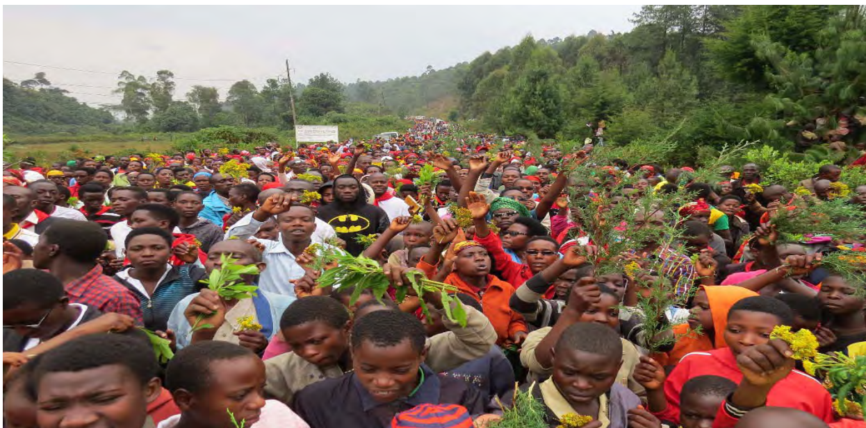
Les jeunes et les adultes en marche pour la paix lors du Forum diocésain à Gitega