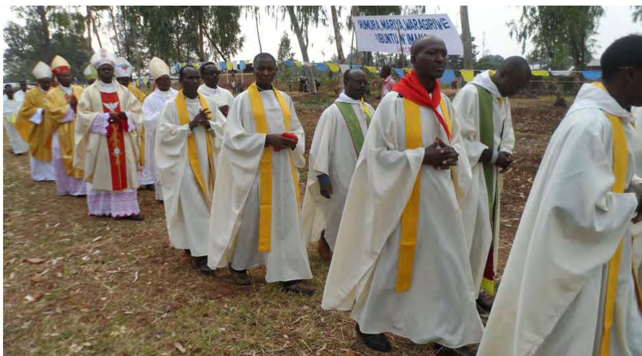
Les Evêques et les prêtres en procession lors de la Messe d'ouverture du Forum national à Cibitoke (Diocèse Bubanza)