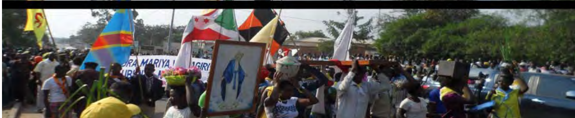
Les jeunes portant la Croix des JNJ et l'icône de la Vierge Marie marchent pour la paix lors du Forum des jeunes