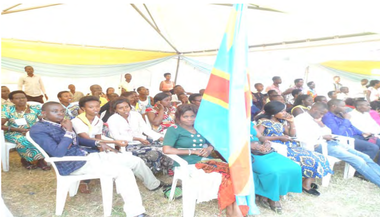
Les jeunes venant de la RDC participent à la formation lors du Forum national des jeunes à Cibitoke (Diocèse Bubanza)