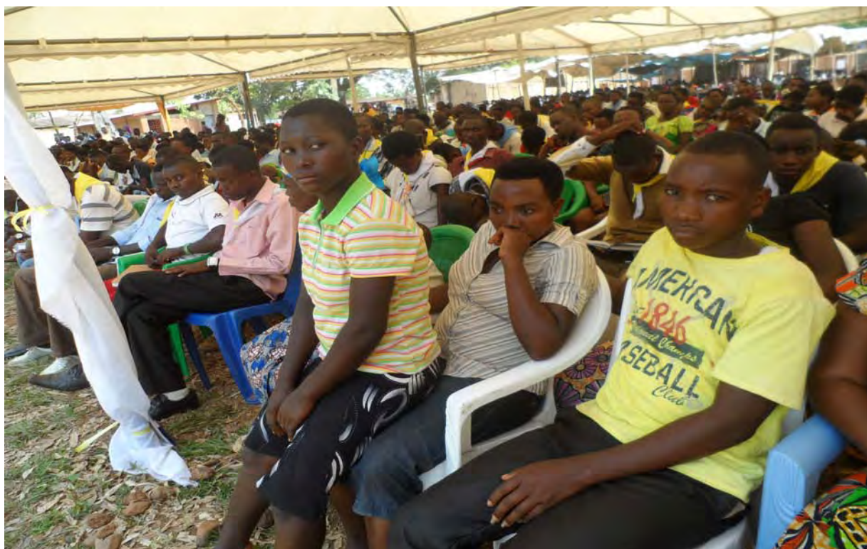
Les jeunes suivent attentivement la conférence lors du Forum