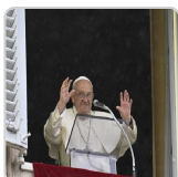
Ángelus en la solemnidad del Cuerpo y la Sangre de Cristo 02/06/2024