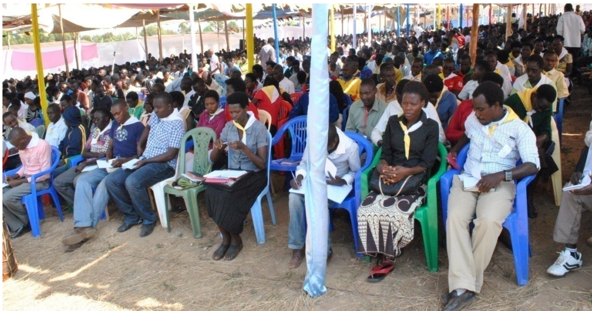
Les délégations des jeunes Congolais participent aux formations lors du Forum des jeunes à Ngozi