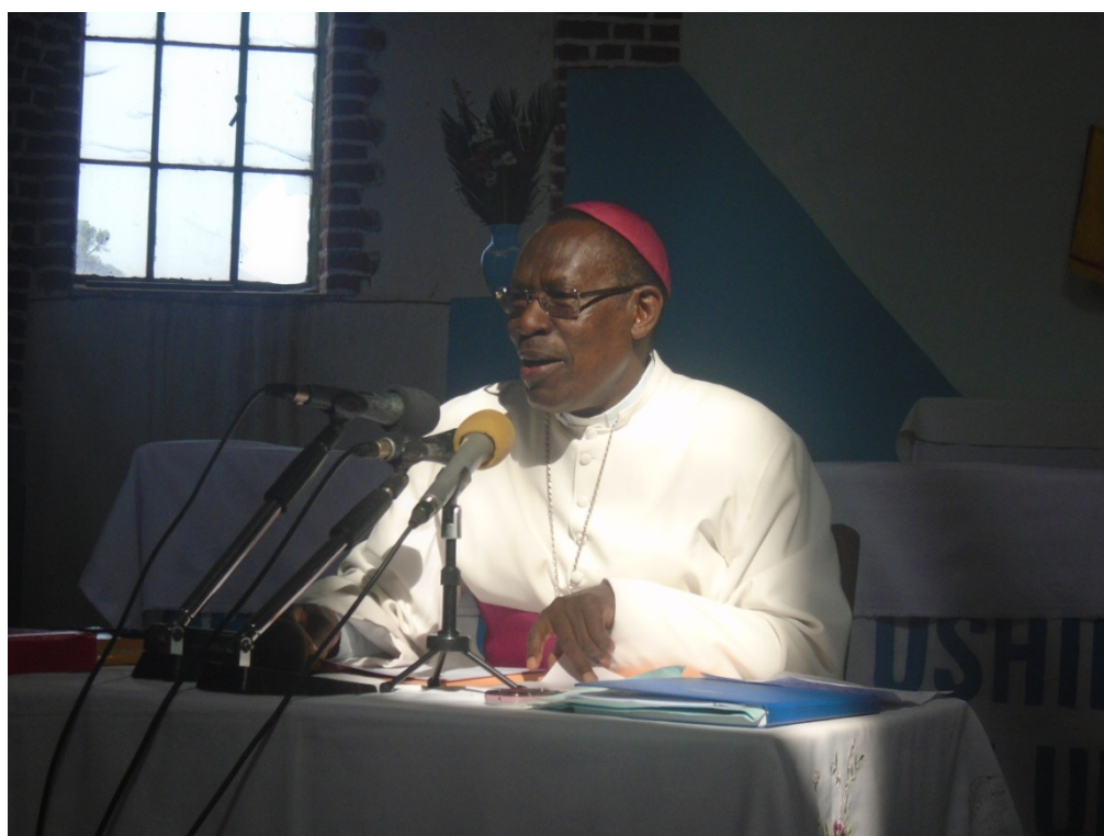
L'archevêque de Gitega donne la conférence aux jeunes lors du Forum diocésain des jeunes à Gitega