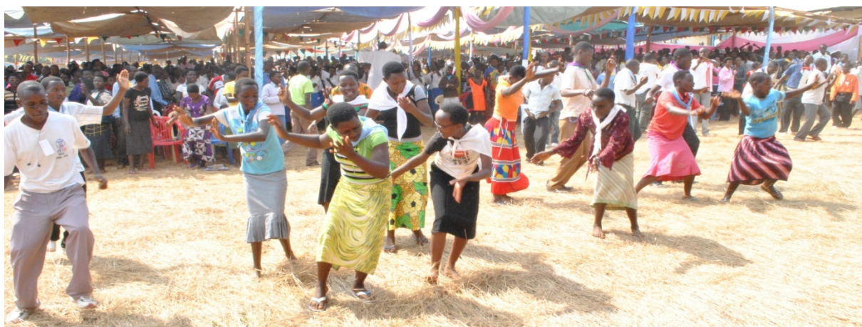
Les jeunes exhibent la joie et dansent lors du Forum des jeunes à Rutana