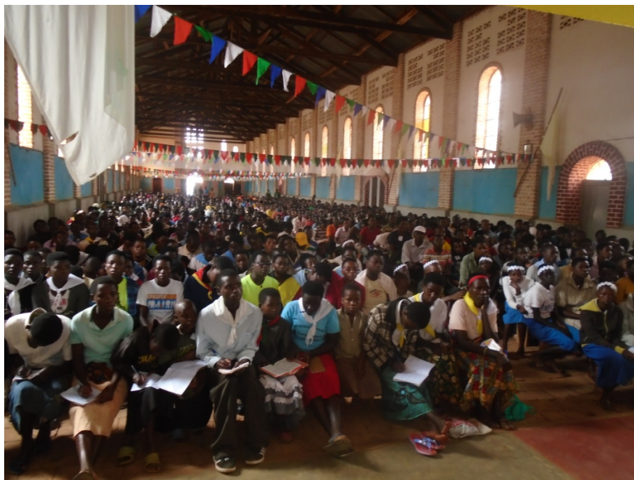
Les jeunes suivent attentivement la conférence lors du forum diocésain à Gitega