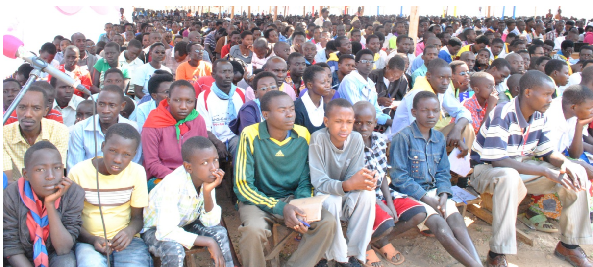
Les jeunes suivent attentivement la formation