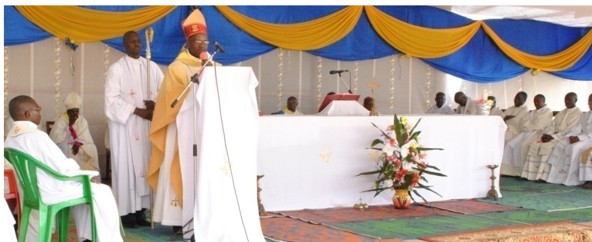
Son Excellence Mgr Gervais BANSIMIYUBUSA Evêque NGOZI et Président de la Conférence des Evêques Catholiques du Burundi donne un Message de paix aux jeunes lors de l'ouverture officielle du Forum National à NGOZI