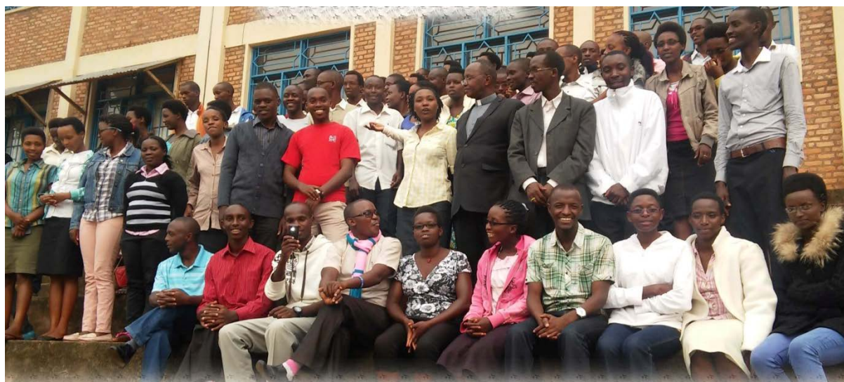
Week-end avec 250 universitaires des différents mouvements d'action catholique de provenance de plusieurs universités sur la non violence et le respect de la i